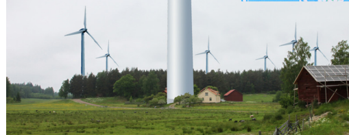
Man tror inte det är sant men verket är ca 30 gånger högre än boningshuset. Givetvis inte planerad på gårdsplanen.

Karta över Ånimskog. De röda cirklarna är säkerhetszonerna