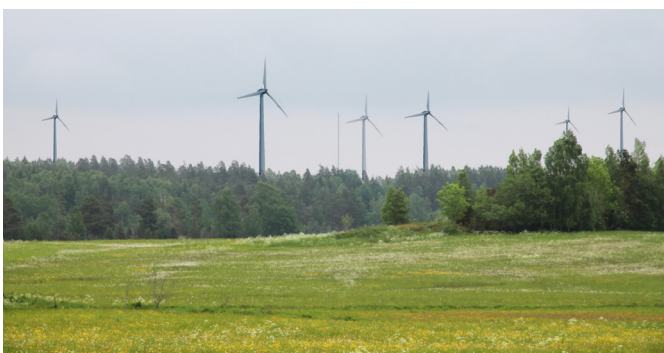
Bild 3. Område Å8 Södra. Vy mot sydost från E45 vid Slobol