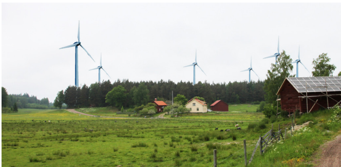
Bild 2. Område Å7 Norra. Vy mot nord-nordväst från Östra Bodane