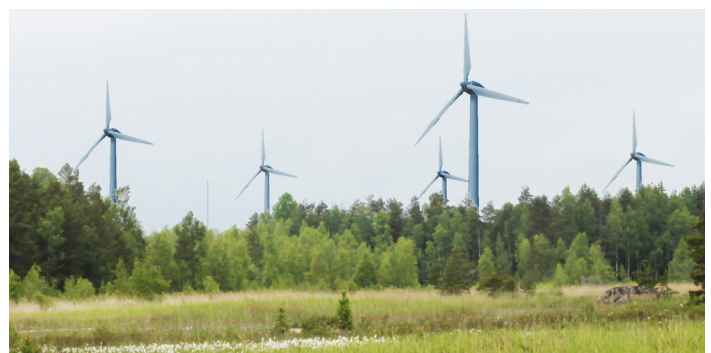
Bild 4. Område Å8 Södra. Vy mot nord-nordväst från Yttre Bodane (Båtbergen, Kesdalen i Naturreservatet)