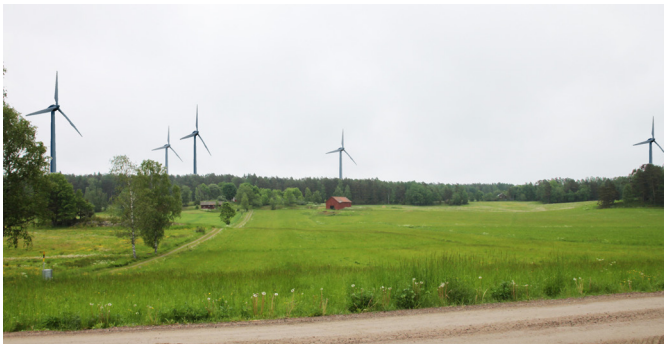
Bild 1. Område Å7 Norra. Vy mot öster från Häkerud

”I samrådsförslaget till Vindbruk Dalsland ingick Ånimskog Norra och Ånimskog Södra i Restriktionsområdena som bedömts olämpliga för vindkraftsetableringar. Genom politiskt beslut i Åmåls kommunstyrelse 2010-03-09, § 58 ansågs området lämpligt för vindbruk. En etablering av vindkraft i området bedöms innebära intressekonflikter mellan friluftsliv och vindbruk.”